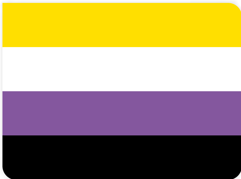
De non-binaire vlag